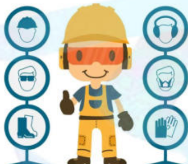
Responsable del SG - SST